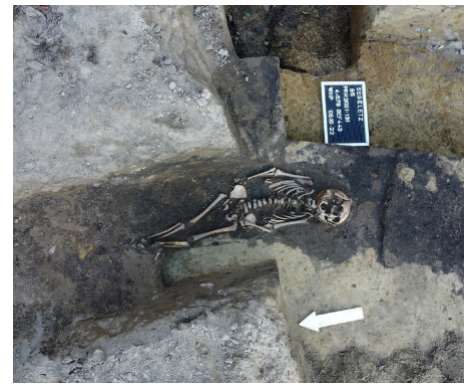
Slawenzeitliche Bestattung eines Mädchens unter der der Ortsdurchfahrt von Segeletz.

"Eine Alternative zur Bergung der Gräber und zur Dokumentation aller anderen von Zerstörung bedrohten archäologischen Relikte gibt es vor dem Hintergrund des Brandenburgischen Denkmalschutzgesetzes nicht", erklärt Jens May, der zuständige Gebietsreferent des Brandenburgischen Landesamts für Denkmalpflege. Und auch die Pietät verbietet es, die Gräber für den Straßenbau einfach wegzubaggern. Der Landesbetrieb Straßenwesen hat mit der Anhebung des Planums für den Bau der zweiten Straßenhälfte auf die aktuelle Situation reagiert, so dass nun viele Bestattungen unter der Straße verbleiben können – damit sinken auch die Kosten. Das BLDAM und das Archäologiebüro Weishaupt, Hahn und Partner, das mit großem Einsatz an den Befunden arbeitet, passten das Grabungskonzept daraufhin entsprechend an. So kann die Dokumentation und Bergung zahlreicher Gräber eingespart werden. "Viele Bestattungen können also unter der Straße im Boden verbleiben und stellen weiterhin einen wichtigen Bestandteil des Bodendenkmals ‚Dorfkern Segeletz‘ und einen Teil der Identität und des kulturellen Gedächtnisses des Dorfes dar", so May.