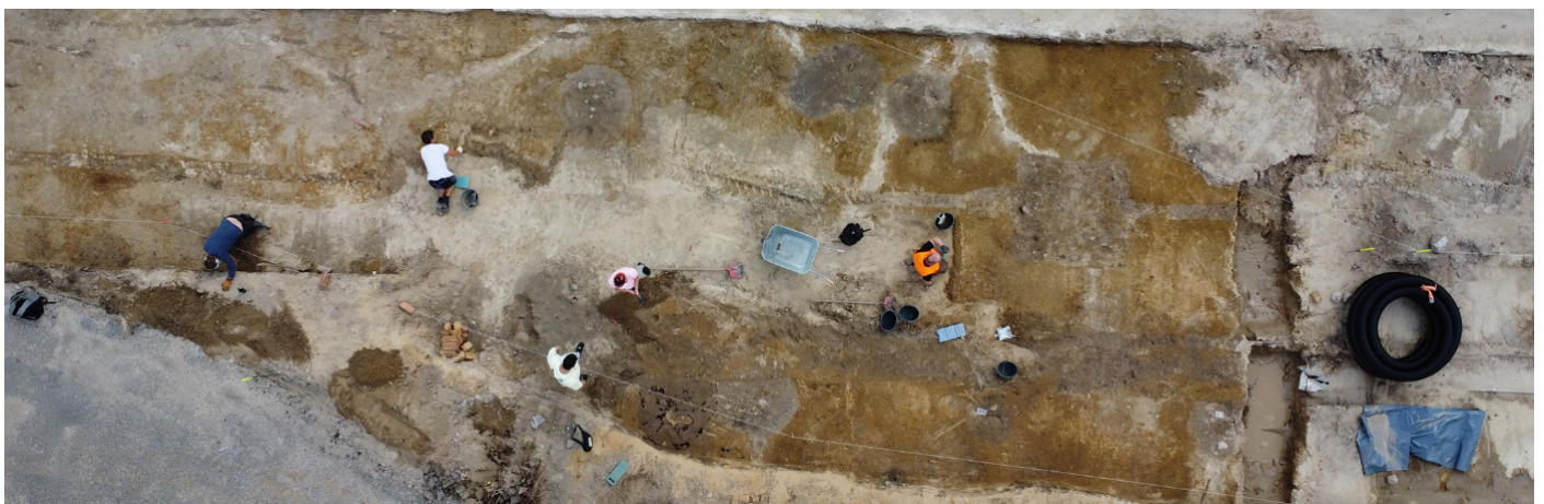
Prähistorische Befunde unter der der Ortsdurchfahrt von Segeletz.

Zu den beigefügten Bildern werden die einmaligen, nichtübertragbaren und nichtausschließlichen Nutzungsrechte erteilt. Presseagenturen dürfen die Bilder im Rahmen ihrer Tätigkeit an Medien weitergeben.