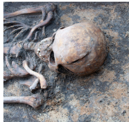
Bestattung eines Mannes mit Schwerthiebverletzung am Schädel

Die Bestatteten sind mit zwei Ausnahmen nach christlichem Brauch in Rückenlage und Ost-West-Richtung niedergelegt worden. Bei etwa der Hälfte der Toten handelt es sich um Kinder. Die meisten der Bestatteten lagen in Särgen, es gibt aber auch zwei Leiter- und eine Leichentuch-Bestattung. Leiterbestattungen waren im Mittelalter üblich, man legte die Toten auf einer leiterartigen Holzkonstruktion ins Grab. Die sarglosen Bestattungen im Leichentuch erkennt man an den eng an den Körper gelegten Armen und den eng zusammenliegenden Beinen. Die menschlichen Überreste lassen zahlreiche Aussagen über den Gesundheitszustand der Menschen zu. Ein großer Teil der Toten zeigt Spuren schwerer körperlicher Arbeit sowie Zeichen für Mangelernährung. Die Zahngesundheit war durchweg sehr schlecht. Bei zwei Individuen hatte sich sogar Zahnstein auf den Kauflächen gebildet, was nur geschieht, wenn mit den Zähnen nicht mehr ge-