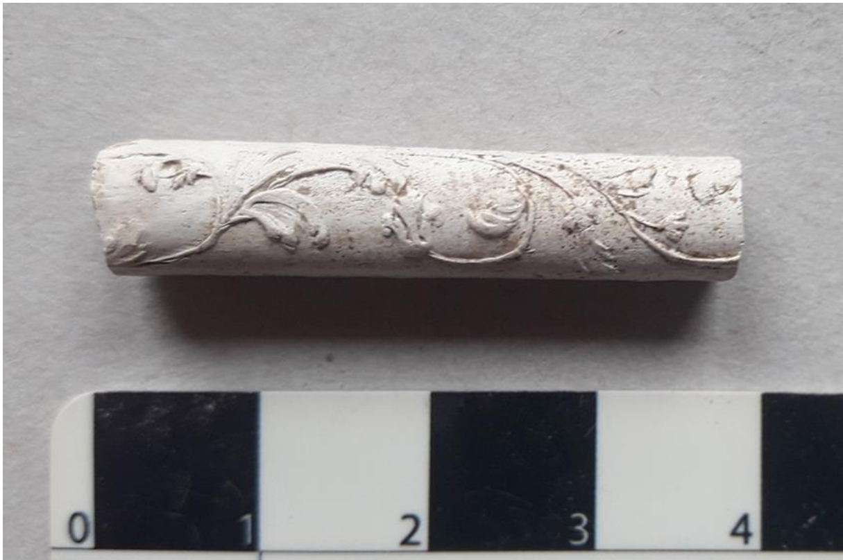
Bruchstück eines Pfeifenstylus. Das Pfeifenrauchen der preußischen Herrscher ist u.a. auf den Gemälden, die das „Tabakskollegium“ zeigen, dokumentiert. Zur Anwendung kamen Pfeifen aus weißem Pfeifenton mit langen, oft verzierten Styli.

Für die beigefügten Fotos werden die einmaligen, nichtausschließlichen und nichtübertragbaren Nutzungsrechte gewährt. Presseagenturen dürfen die Fotos im Rahmen ihrer Aufgaben weitergeben. Die Urheber sind zu nennen. Bitte fordern Sie druckfähige Vorlagen per Mail an: christof.krauskopf@bldam-brandenburg.de