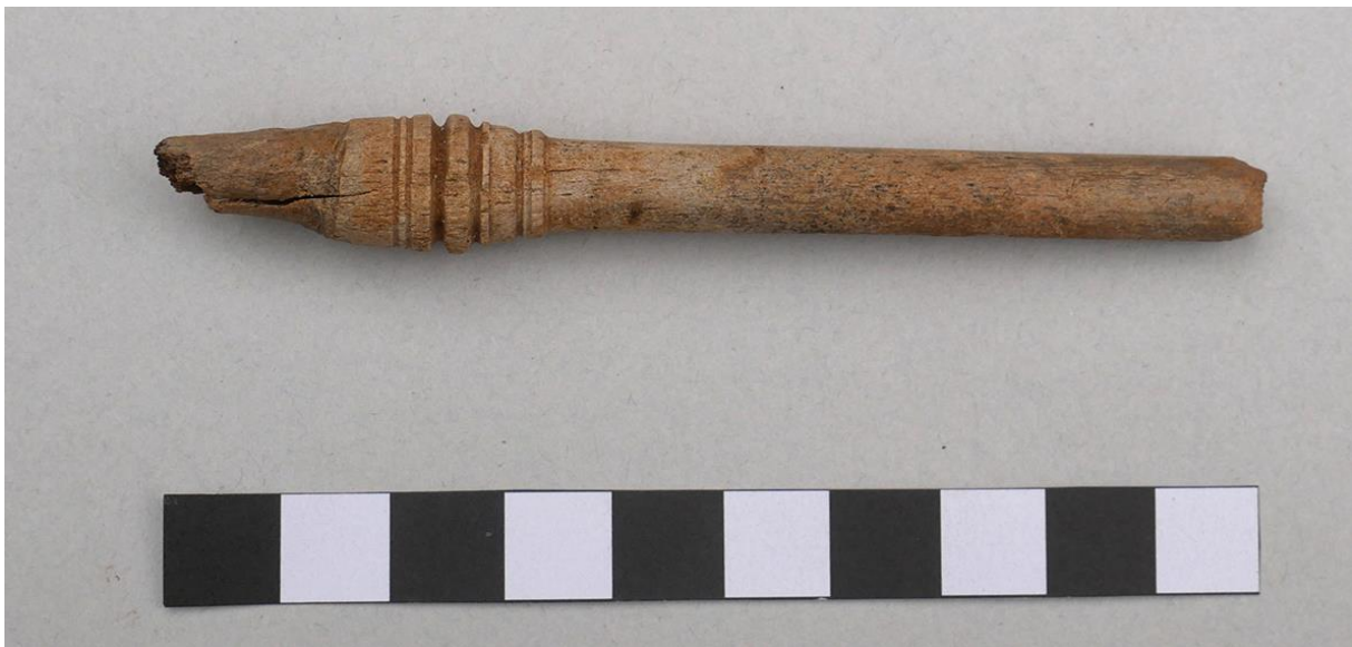
Spindelfragment aus Knochen, vermutlich 18. Jh.

Von partiellen Zerstörungen zeugen archäologisch nachgewiesene Brandhorizonte. Feuer stellte eines der größten Risiken in Siedlungen dar, bevor man auf offenes Feuer und Licht verzichten konnte. Auf dem Areal stellen die Mühlenreste jedoch nicht die einzigen Befunde dar. 2020 wurde südlich der denkmalgeschützten „Neuen Halle“ ein Altarm der Nuthe erfasst, dessen Ufer die Menschen bereits seit vorgeschichtlicher Zeit nutzten. Die Ausgrabungen werden voraussichtlich noch bis Ende Oktober fortgesetzt.