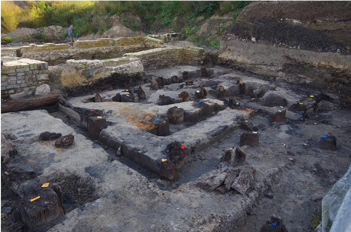
Pfahlgründungen eines der Mühlengebäude, dahinter Steinfundamente einer weiteren Mühle.

Fundamente und Pfahlgründungen stammen aus der Zeit zwischen der zweiten Hälfte des 17. und der Mitte des 19. Jahrhunderts. Als Mühlenstandorte konnten die Baureste anhand einer Karte von 1683 identifiziert werden.